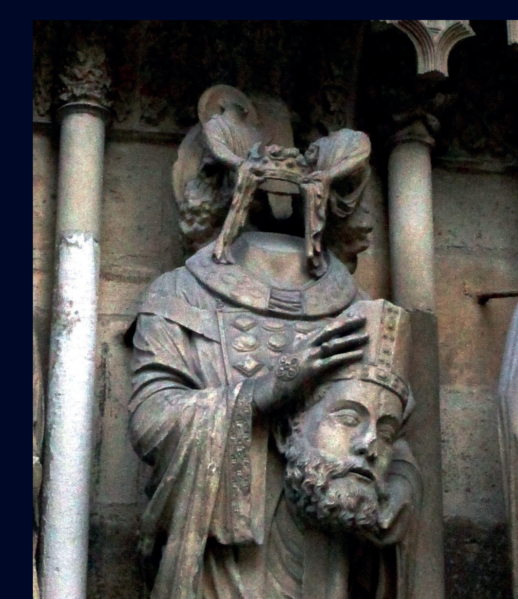
L'évêque Nicaise Bishop Nicaise