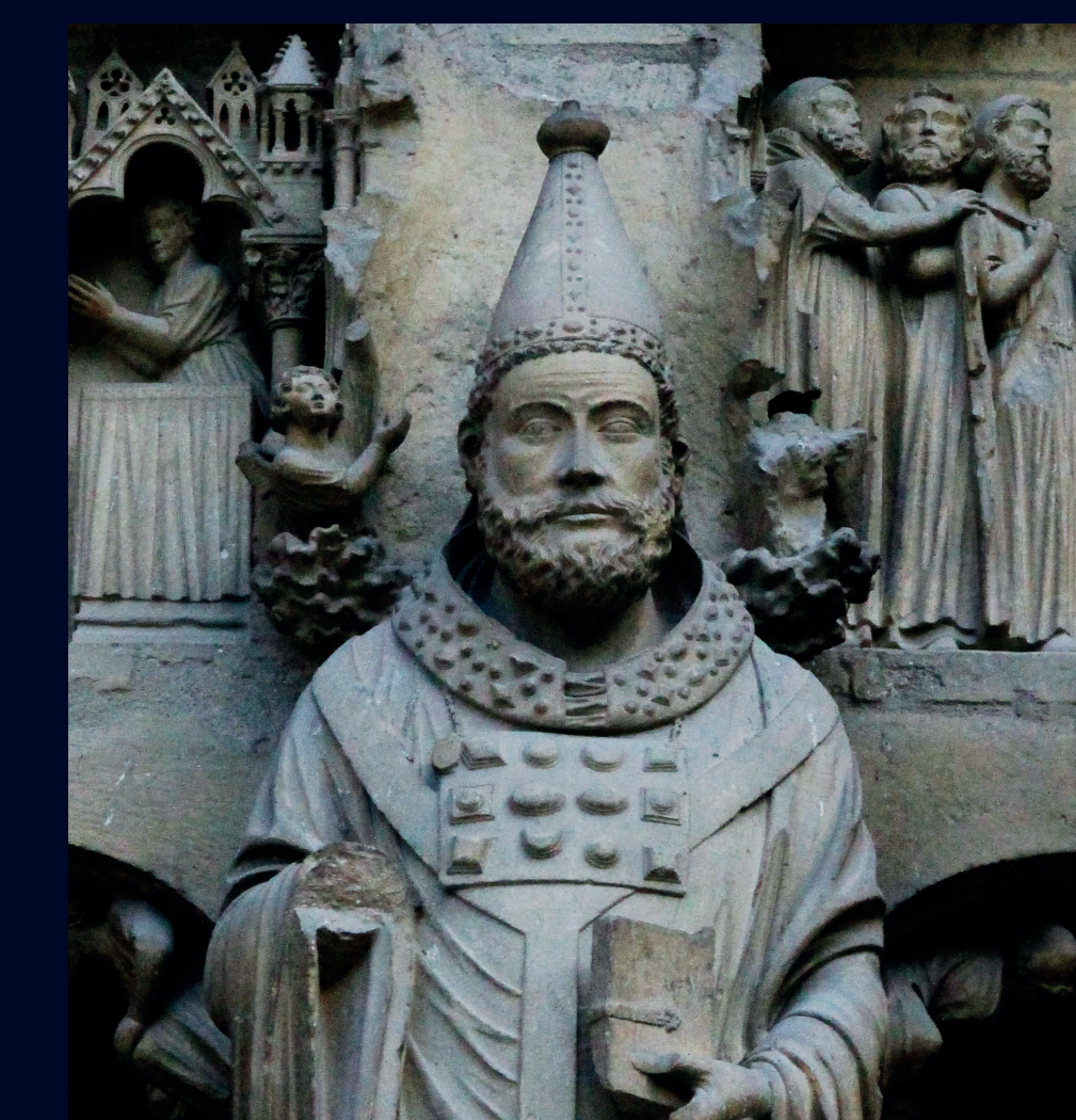
L'évêque Sixte Bishop Sixtus

In 407, during a barbarian invasion, Rheims people took refuge in the cathedral. Bishop Nicaise tried to negotiate - but he was beheaded on the threshold of his church.