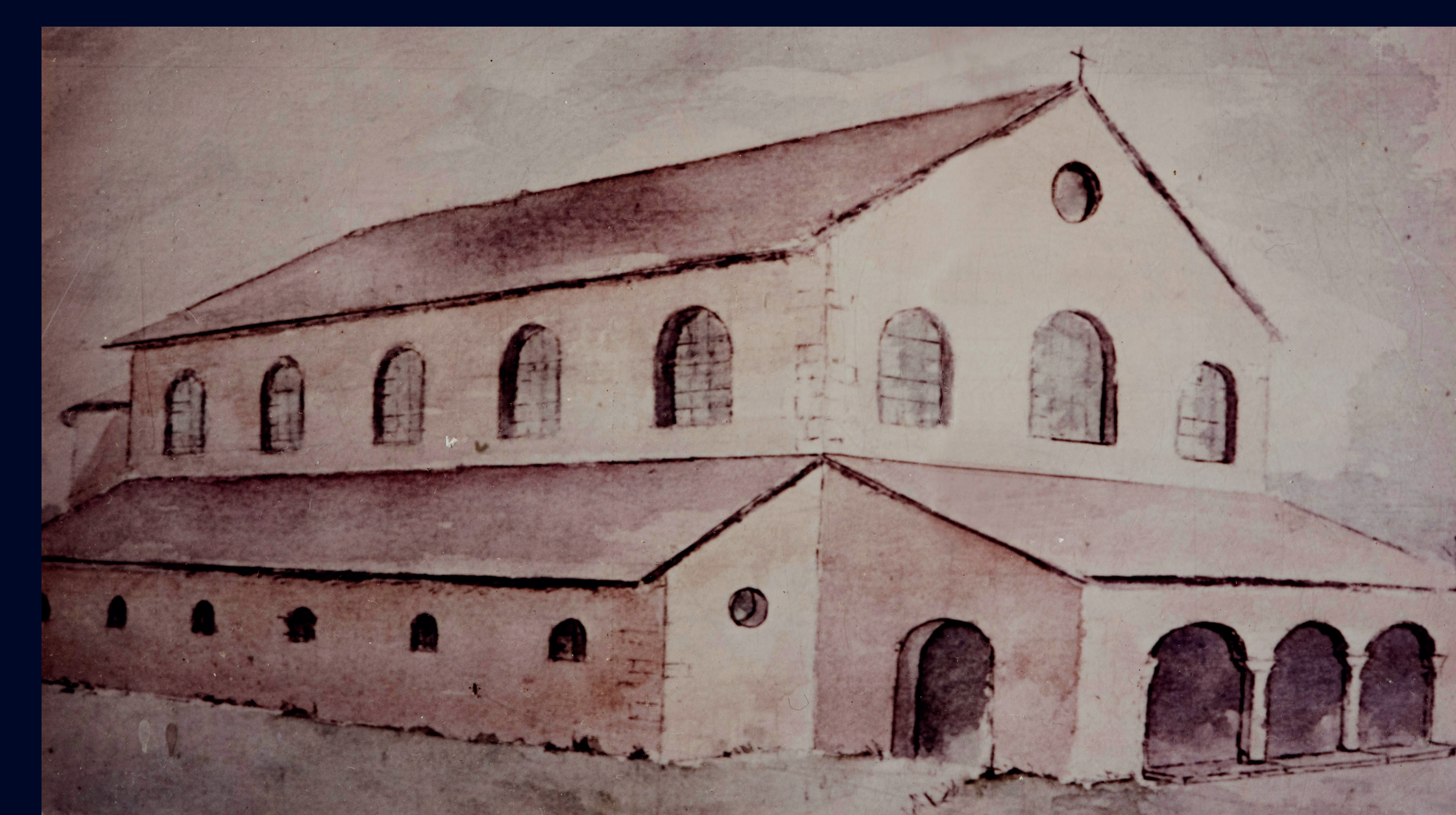
La cathédrale de saint Nicaise The saint Nicaise cathedral