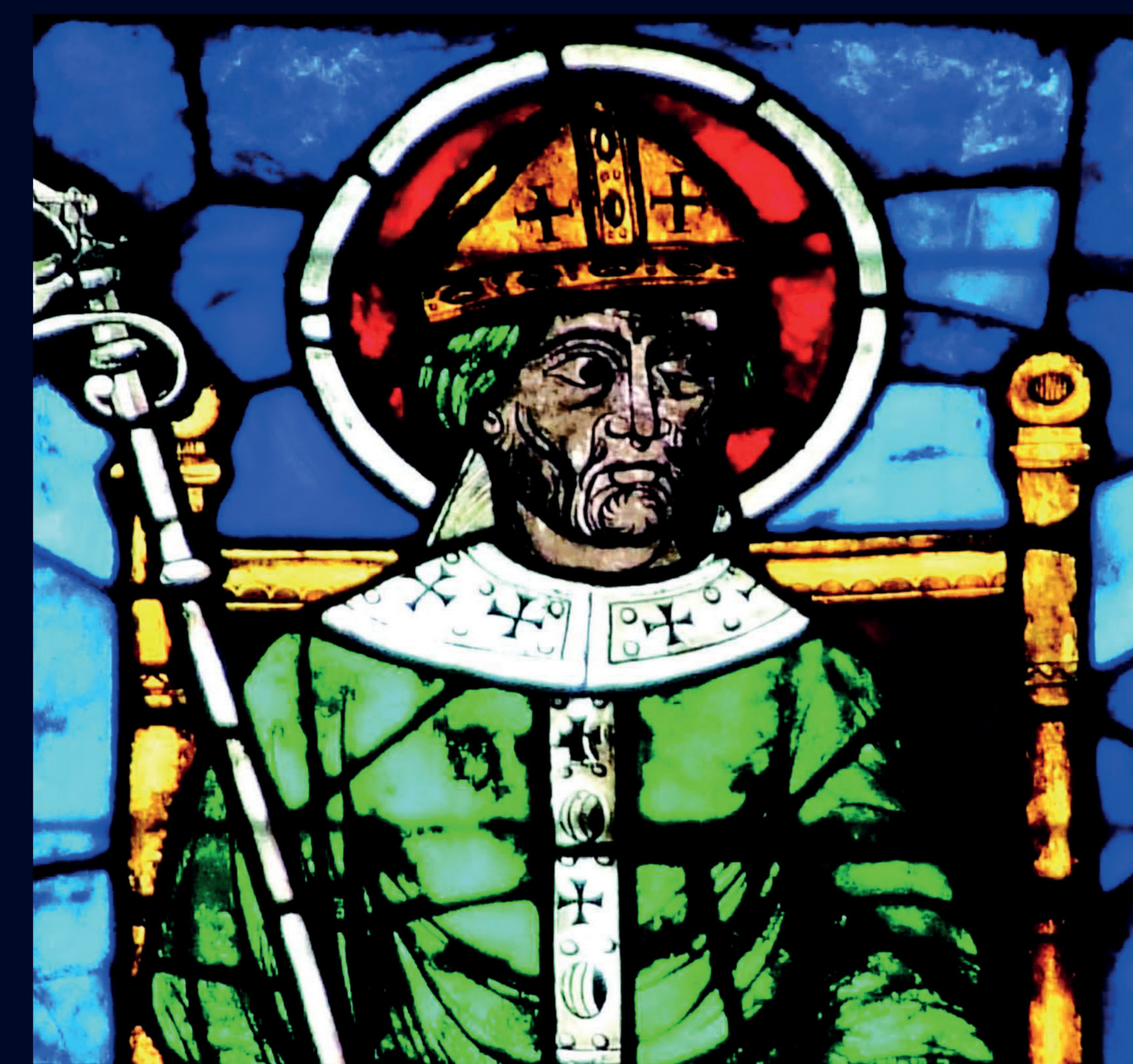
Un Evêque A Bishop