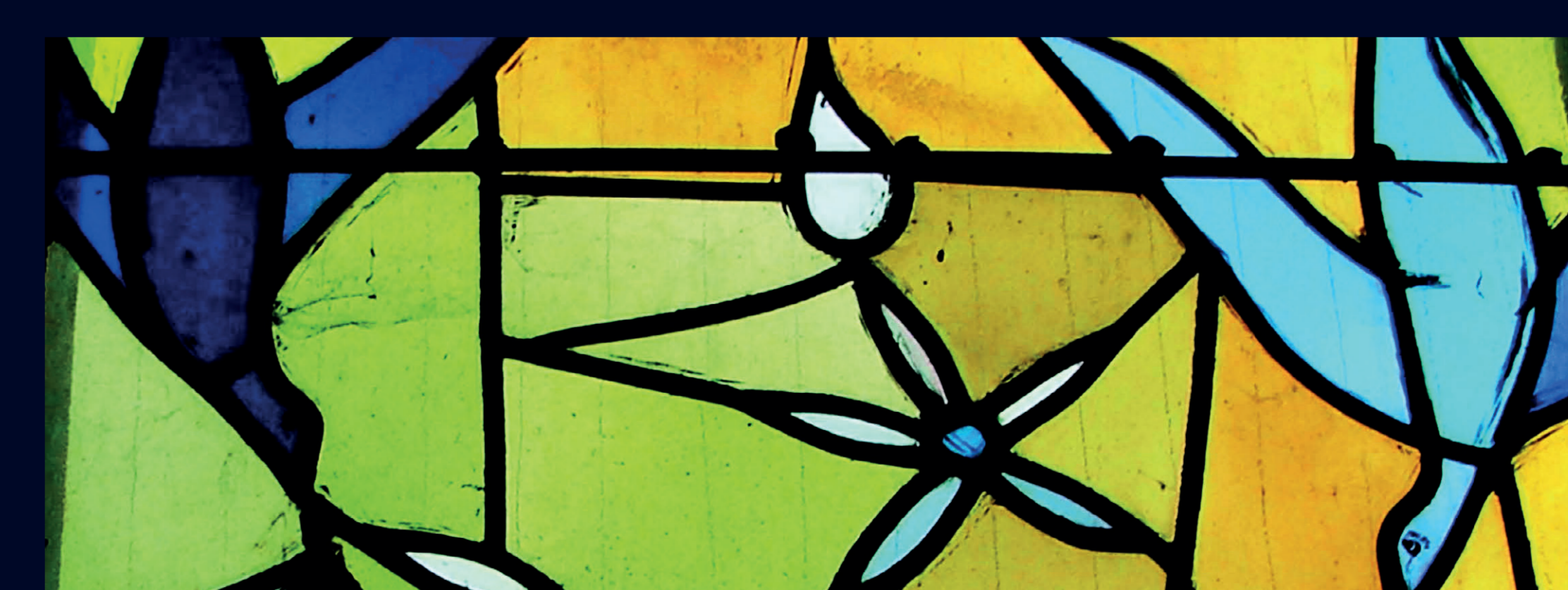
La Sainte Ampoule (détail) The Holy Bulb (detail)

One in the northern arm of the transept: a stained glass window by Jacques Simon in a 17 th century rose (1958). The other in the southern arm with its flamboyant façade made by Robert de Lenoncourt: a window by the Brigitte Simon and Charles Marq workshop - daughter and son-in-law of Jacques Simon - representing a flight of doves inspired by the legend of the Holy Bulb (1970). A third one in the axial chapel: a contemporary play on perspective made by Charles Marq (1976). Grisailles are also placed in the lower windows of the apse chapels.