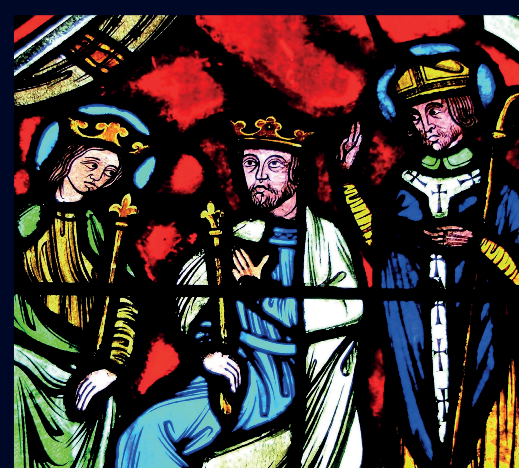
Saint Remi bénit Clovis et son épouse Sainte Clotilde Saint Remi blesses Clovis and his wife Saint Clotilde