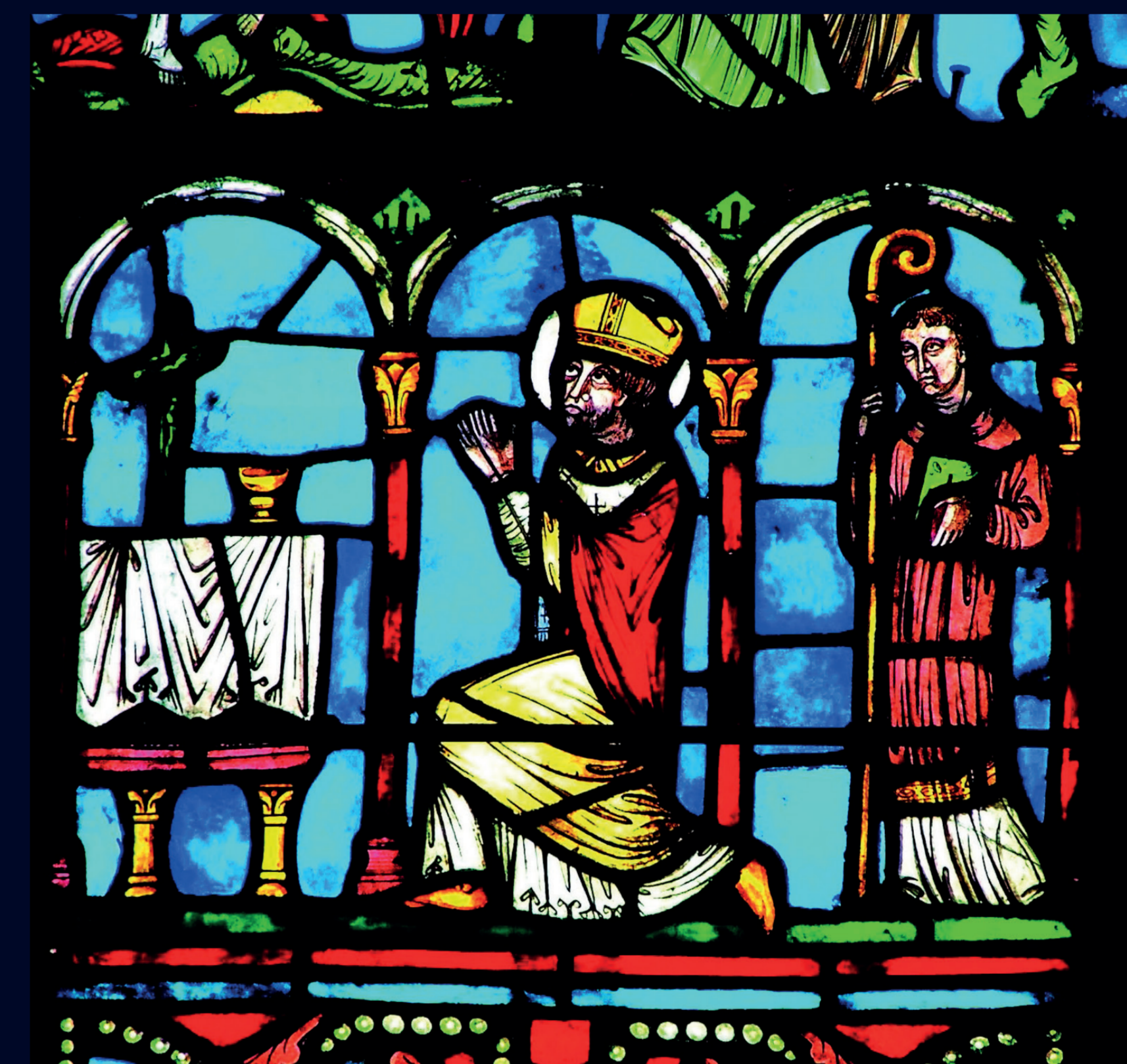
Saint Remi en prière et l'ermite Montan Saint Remi praying and hermit Montan