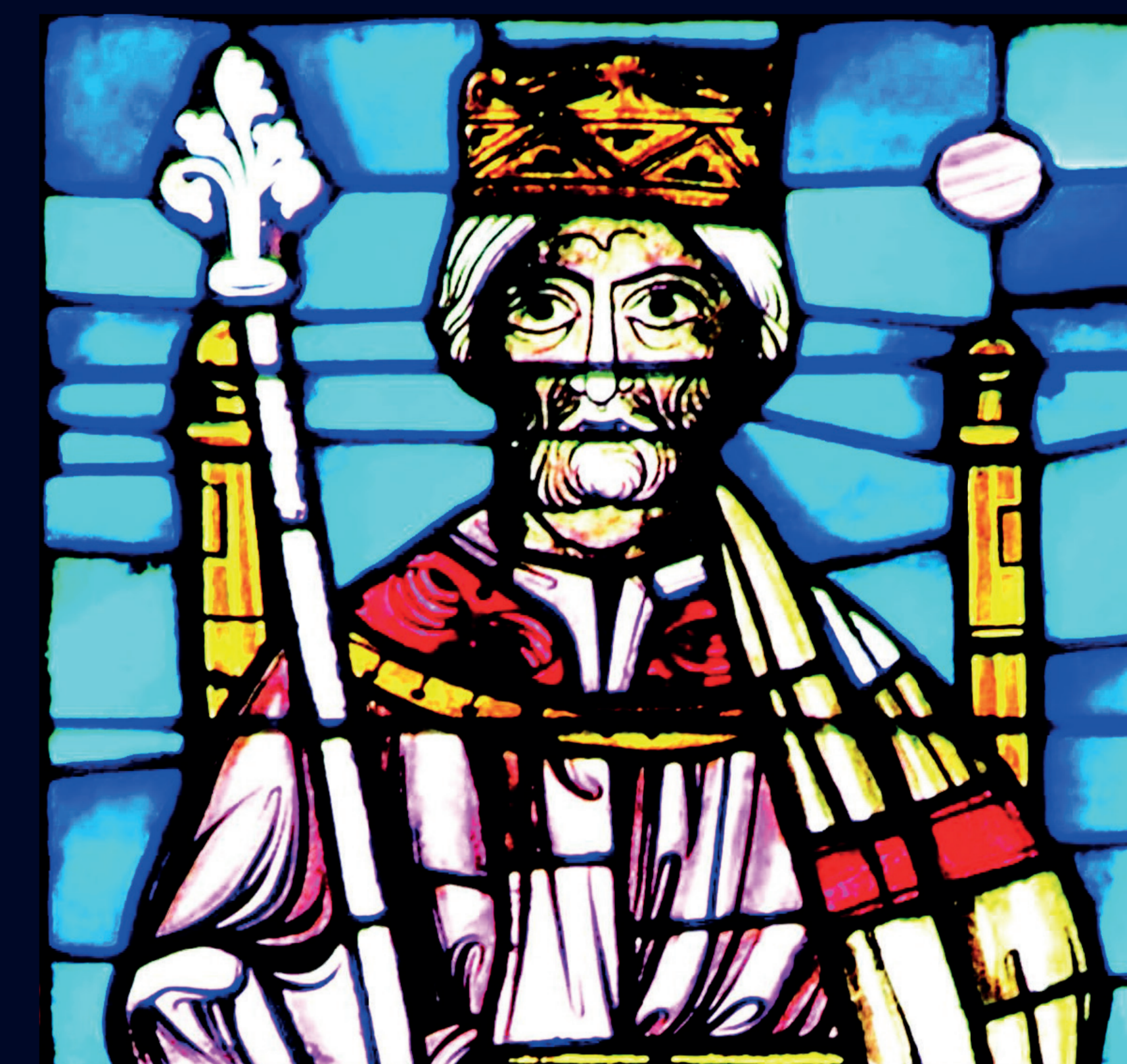
Un Roi A King