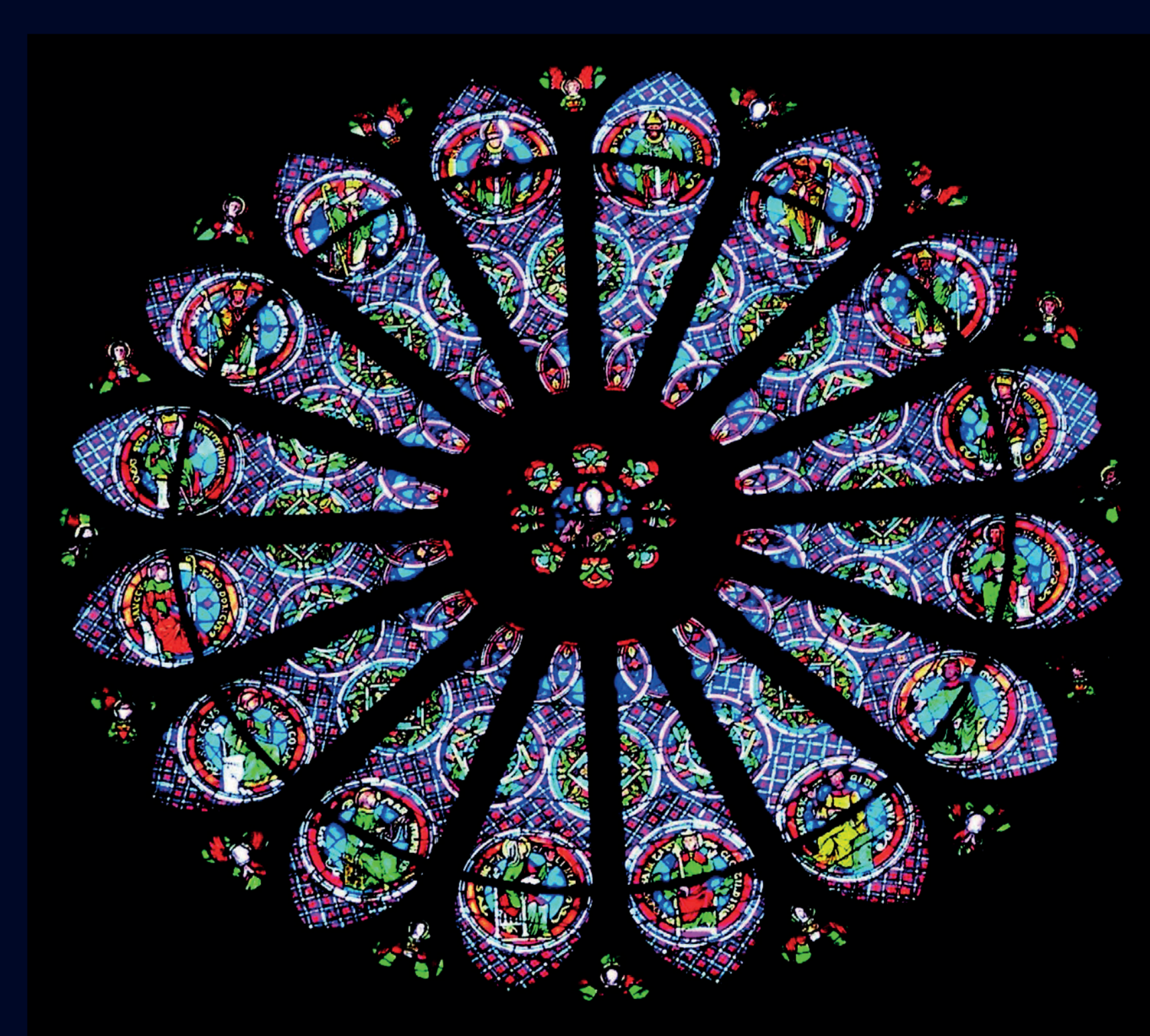
La rose centrale de la nef The central rose of the nave

In spite of the destructions, an exceptional collection of 12 th century stained glass windows in the gallery (Crucifixion) and the high windows of the choir (apostles and prophets surmounting the procession of the archbishops of Reims) have been preserved in the basilica. In the nave, kings sit enthroned; the Romanesque windows were completed in the 19 th century.