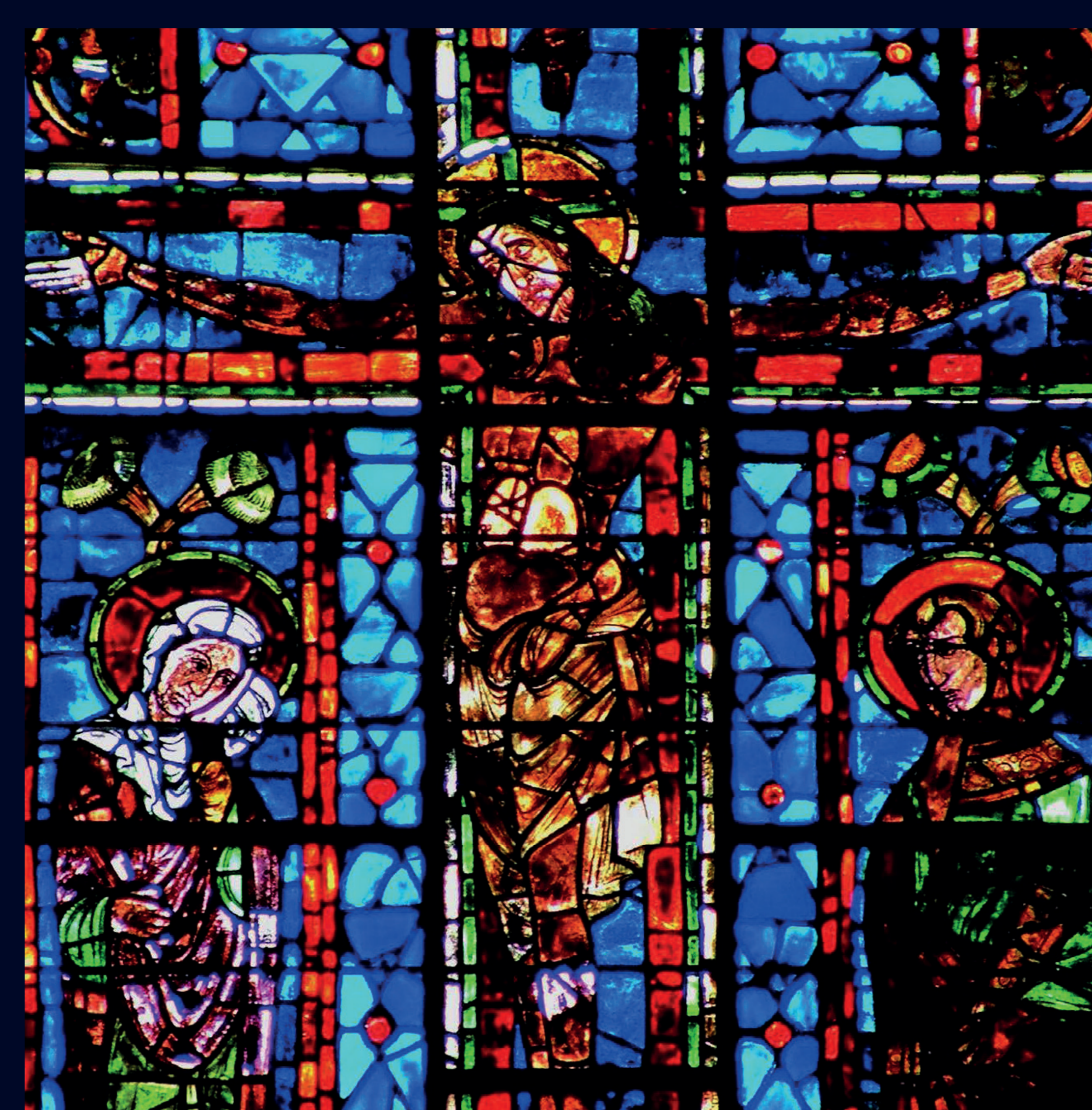
Vitrail de la Crucifixion Stained glass window of the Crucifixion

Ancienneté Restauration Création Antiquity Restoration Creation